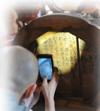
三五〇年前の善行のお名前が 台座の中に墨書きで鮮明に残る