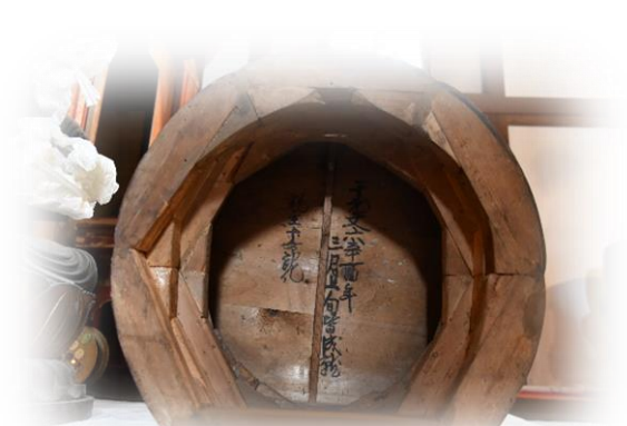
江戸時代 寛文六年（1666年）の文字が