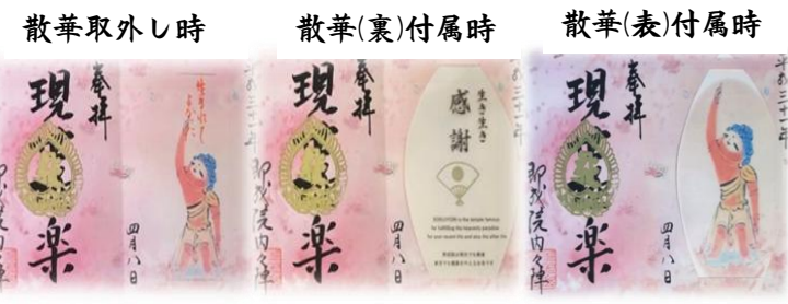
散華取外し時 散華(裏)付属時 散華(表)付属時 中央キリクの印と散華裏面扇の色は金色銀色朱色の三種類

見開き 1枚 1千円で授与 (散華付) 散華の表面 (おもてめん) 色は2色から選べます