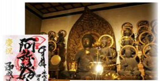
内々陣：現世極楽浄土 特別拝観 公開中

【授与所】 本堂受付 9:00 ~ 17:00 その他、お寺の情報はコチラから http://www.negaigamatoe.com