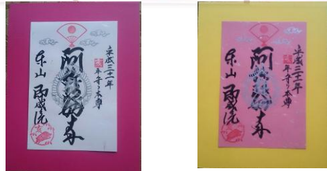
色は5色 1枚5百円で授与